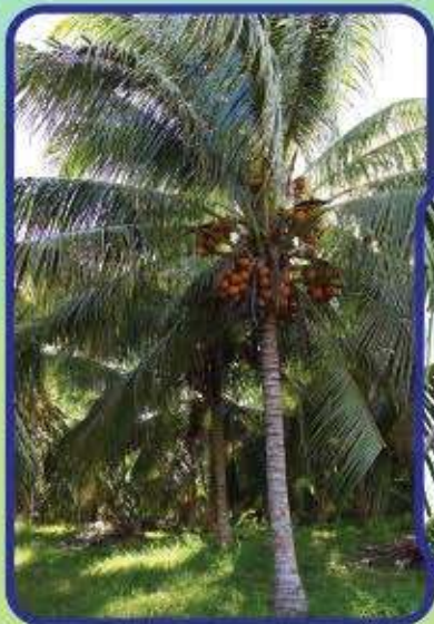
Pokok Kelapa MATAG Tulen

Anak benih kelapa hibrid MATAG TULEN yang dihasilkan melalui proses kacukan silang yang telah sedia untuk edaran dan ditanam di ladang.