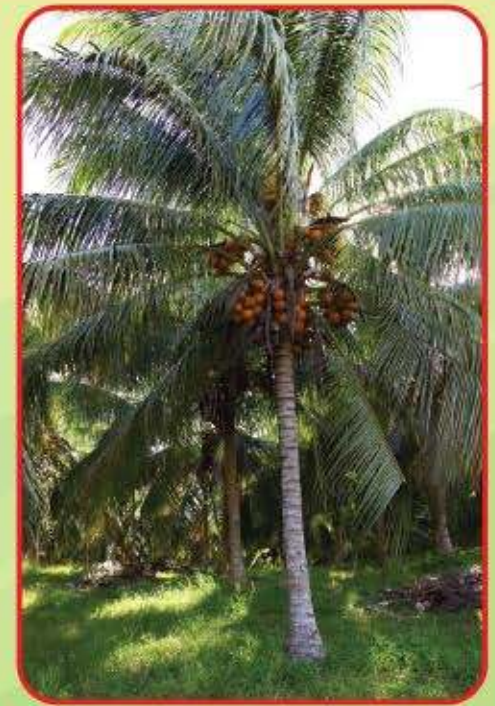
Pokok Kelapa MATAG Tulen

Buah tua dari pokok kelapa hibrid MATAG tulen tersebut TIDAK BOLEH digunakan untuk tujuan mengeluarkan anak benih kerana ianya merupakan generasi F2 dan BUKAN HIBRID dan akan menyerupai ciri-ciri induk (MYD/MRD/ Tagnanan) dan ianya BUKAN kelapa hibrid MATAG tulen.